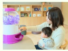
今日のミッションは何？ドキドキ！