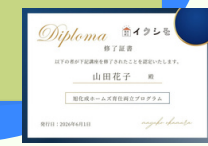
修了証とイクシモマーク授与