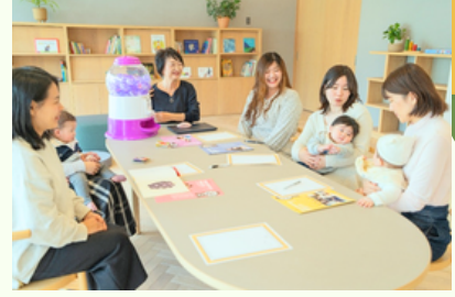
育仕両立のテーマでワイワイトーク