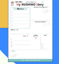
イクシモストーリー制作